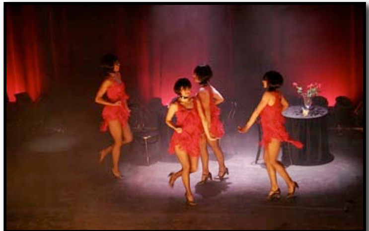
« Charleston »

Ambiance cabaret feutré : jazz, musique ,chansons francophones et anglophones, Swing, Fosse, Broadway, « Un américain à Paris », chorégraphies et séduction des années folles.